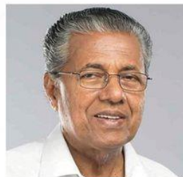
Sri. PINARAYI VIJAYAN Hon'ble Chief Minister of Kerala